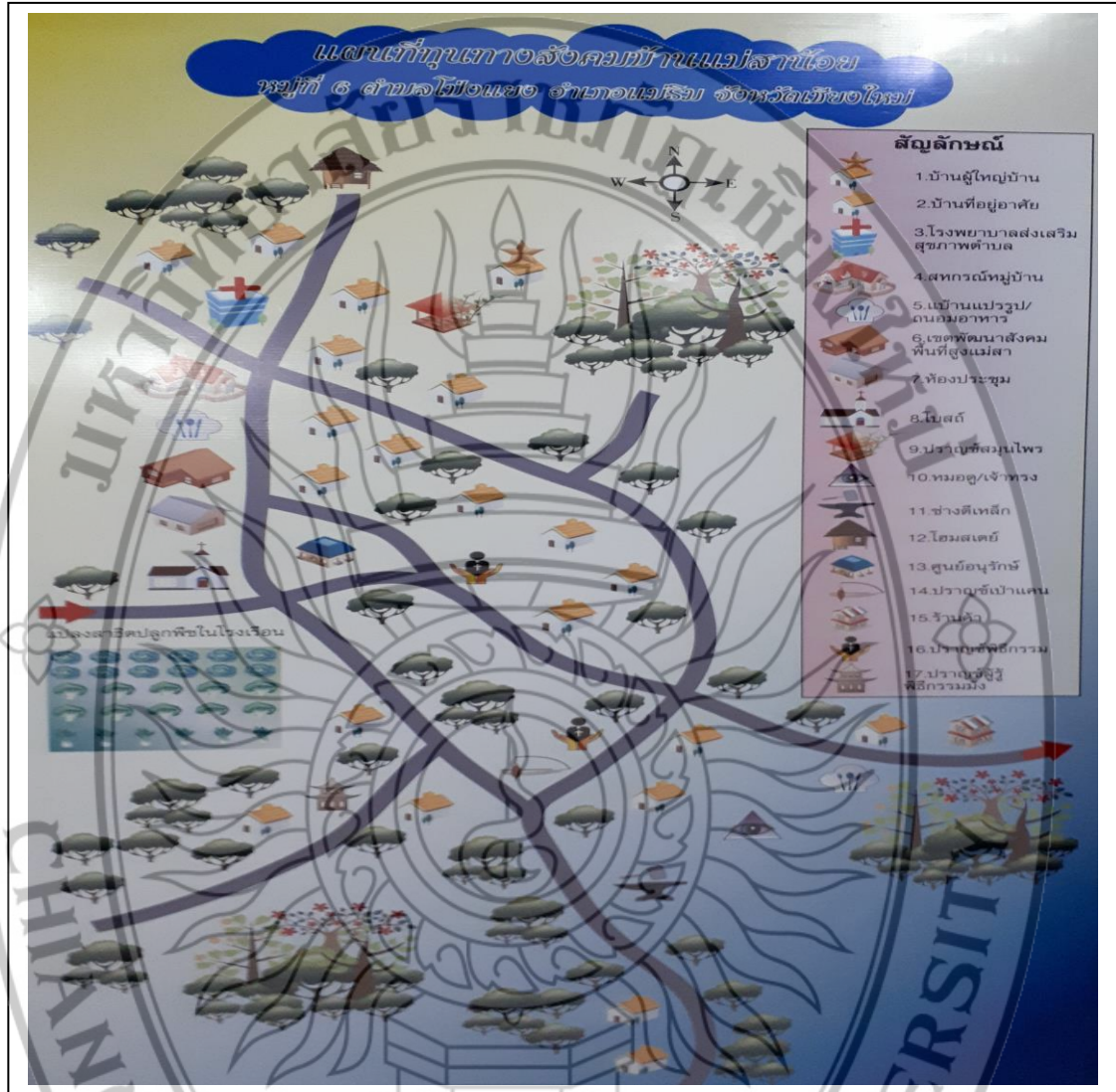
ภาพที่ 1.5 สถานที่สำคัญของชุมชนบ้านแม่สาใหม่

ส่วนสถานที่ตั้งในชุมชนที่ถือว่าเป็นทุนทางสังคมของชุมชน ซึ่งจะแสดงถึงสถานที่สำคัญของชุมชน ที่ถือว่าเป็นทุนทางสังคมที่สร้างเป็นอยู่ที่ดีให้กับชุมชน ดังแสดงได้ดังภาพที่ 1.5