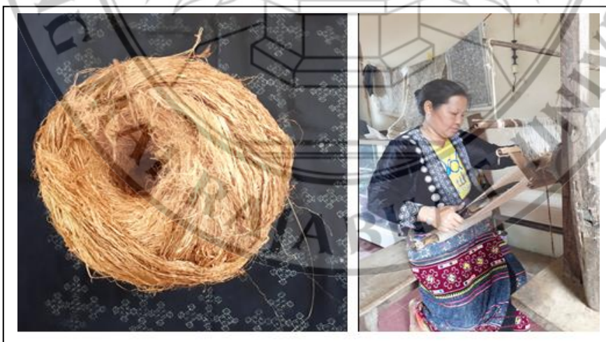
ภาพที่ 1.4 เส้นใยกล้วย วิธีการทอผ้าใยกล้วยของชนเผ่าม้ง แม่สาใหม่

ดังนั้นบ้านของชนเผ่าม้งจึงเป็นสถานที่ที่นิยมของนักท่องเที่ยวในการเดินทางมาเยี่ยมชมวิถีชีวิตของชนเผ่าดั้งเดิม พร้อมกับธรรมชาติที่แสนจะงดงามของหมู่บ้าน โดยลักษณะของบ้านแต่ละหลังในหมู่บ้านจะยังคงเป็นบ้านไม้แบบดั้งเดิม โดยจะมีบางหลังที่สร้างด้วยคอนกรีต ซึ่งชุมชนแม่สาใหม่นั้นถือว่าเป็นชุมชนขนาดใหญ่ ที่ประกอบไปด้วยชาวม้งสองกลุ่ม คือ ม้งสายและม้งขาว โดยคงไว้ซึ่งวิถีชีวิตแบบดั้งเดิมในการประกอบอาชีพเกษตรกรรมอยู่ และยังคงมีชีวิตแบบเก่าให้เห็น เช่น การทำข้าวซ้อมมือ การละเล่น เครื่องมือยังชีพ และหัตถกรรมต่าง ๆ และชมอาคารวัฒนธรรมชุมชนที่จัดแสดงภาพประวัติหมู่บ้าน เครื่องมือในการทำผ้าใยกล้วย ทั้งยังมีศูนย์วัฒนธรรม และพิพิธภัณฑ์ทอผ้าใยกล้วย ดังภาพที่ 1.4