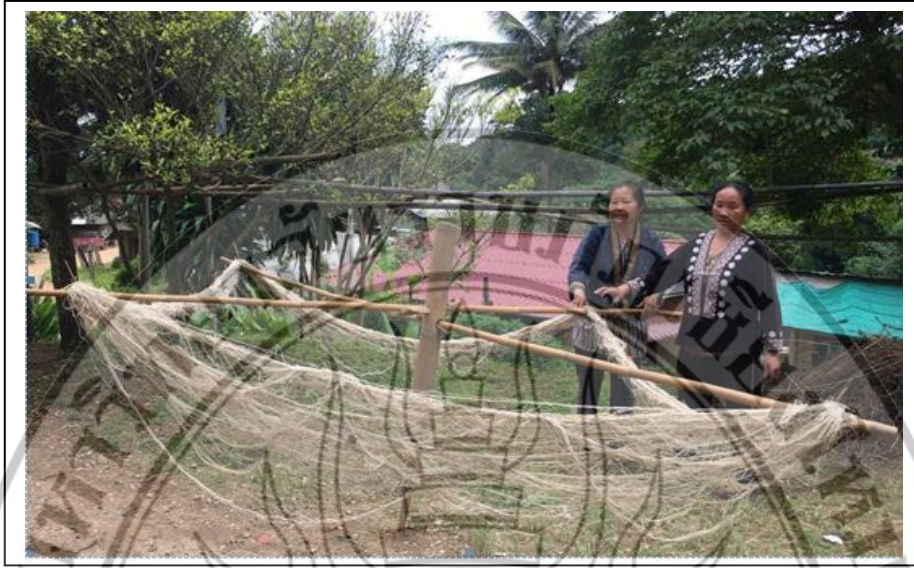
ภาพที่ 1.3 การตากเส้นใยกล้วยสำหรับนำมาทอเป็นผลิตภัณฑ์ของชนเผ่าม้ง แม่สาใหม่

ดังนั้นบ้านของชนเผ่าม้งจึงเป็นสถานที่ที่นิยมของนักท่องเที่ยวในการเดินทางมาเยี่ยมชมวิถีชีวิตของชนเผ่าดั้งเดิม พร้อมกับธรรมชาติที่แสนจะงดงามของหมู่บ้าน โดยลักษณะของบ้านแต่ละหลังในหมู่บ้านจะยังคงเป็นบ้านไม้แบบดั้งเดิม โดยจะมีบางหลังที่สร้างด้วยคอนกรีต ซึ่งชุมชนแม่สาใหม่นั้นถือว่าเป็นชุมชนขนาดใหญ่ ที่ประกอบไปด้วยชาวม้งสองกลุ่ม คือ ม้งสายและม้งขาว โดยคงไว้ซึ่งวิถีชีวิตแบบดั้งเดิมในการประกอบอาชีพเกษตรกรรมอยู่ และยังคงมีชีวิตแบบเก่าให้เห็น เช่น การทำข้าวซ้อมมือ การละเล่น เครื่องมือยังชีพ และหัตถกรรมต่าง ๆ และชมอาคารวัฒนธรรมชุมชนที่จัดแสดงภาพประวัติหมู่บ้าน เครื่องมือในการทำผ้าใยกล้วย ทั้งยังมีศูนย์วัฒนธรรม และพิพิธภัณฑ์ทอผ้าใยกล้วย ดังภาพที่ 1.4