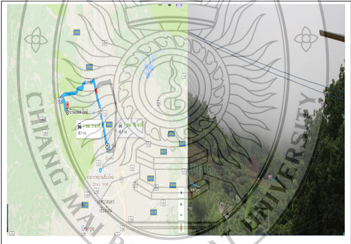
ภาพที่ 1.1 แผนที่บ้านมิ่ง แม่สาใหม่ ตั้งอยู่ หมู่ที่ 6 ตำบลโป่งแยง อำเภอแม่ริม จังหวัดเชียงใหม่ ที่มา ( https://www.google.co.th/maps/dir/18.8067245,98.9857254/บ้านแม่สาใหม่ )

บ้านมิ่ง แม่สาใหม่ ตั้งอยู่ หมู่ที่ 6 ตำบลโป่งแยง อำเภอแม่ริม จังหวัดเชียงใหม่ ตั้งอยู่บริเวณหุบเขาใกล้ห้วยสายเล็ก ๆ มีหุบเขาล้อมรอบ อยู่สูงจากระดับน้ำทะเล 1,000 เมตร มียอดเขาสูงสุด 1,400 เมตร พื้นที่ส่วนใหญ่จะลาดชัน มีพื้นที่ราบน้อย สภาพป่าจะเป็นป่าดิบเขา และป่ากึ่งเบญจพรรณ ส่วนเส้นทางที่สามารถเข้าถึงหมู่บ้าน ได้ตลอดฤดูกาลมีเพียงเส้นทางเดียว คือ เส้นทางแยกจากทางหลวง สายแม่ริม-สะเมิง ตรงบริเวณวัดบ้านโป่งแยงนอก โดยระยะทางจากทางแยกถึงหมู่บ้าน 7 กิโลเมตร และจากทางแยกเข้าสู่ตัวเมือง 22 กิโลเมตรหรือชุมชนอยู่ห่างจากตัวเมืองเชียงใหม่ 39 กิโลเมตร ดังภาพที่ 1.1