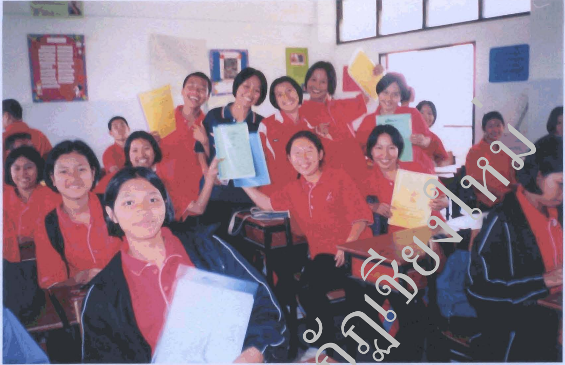
ภาพนักเรียนแสดงความภูมิใจ ในแฟ้มสะสมงานของตน