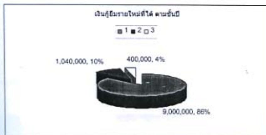
กราฟที่ 2 แสดงเงินกู้ยืมรายใหม่ที่ได้ ตามชั้นปี